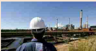
SIDERURGIA | 04 giugno 2018 Ilva, «prova del 9» per il governo Conte. Mittal e sindacati pronti a vedere Di Maio

I Cinque Stelle sono da sempre portatori di soluzioni radicali per l'Ilva di Taranto, comprese in uno spettro che va dalla chiusura dell'impianto a una sua riconversione nel senso della decarbonizzazione. Una opzione - quest'ultima - che durante le ultime elezioni ha rappresentato una sorta di campo comune con l'ala del Partito Democratico - in Puglia personificata da Michele Emiliano - più