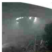
Risveglio da incubo per gli amici dell'UNITALSI Dalle prime ore del ...