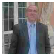
L'appello della Uil Temp di Reggio Calabria: "Gli Enti territoriali rispondano all'Avviso pubblico ..." "Gli Enti benefici...