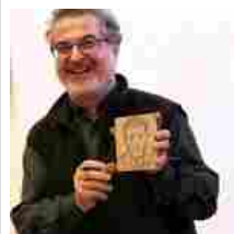
Xilografia a Sbalzo su Rame, l'innovativa tecnica