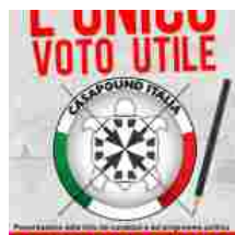
Domani al Comune CasaPound Italia presenta i candidati catanzaresi Raf...